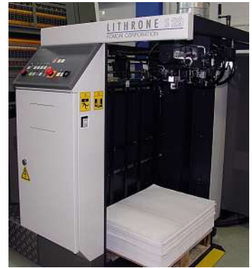
Der Anleger verfügt über automatische Stapelausrüstung und eine Ultraschall-Doppelbogenkontrolle.

Komori LS 529 HC plus Lack mit Infrarot- und einer zusätzlichen UV-Trocknung von Nordson versehen, ist also sowohl für Dispersions- als auch für UV-Lack-Verarbeitung geeignet.