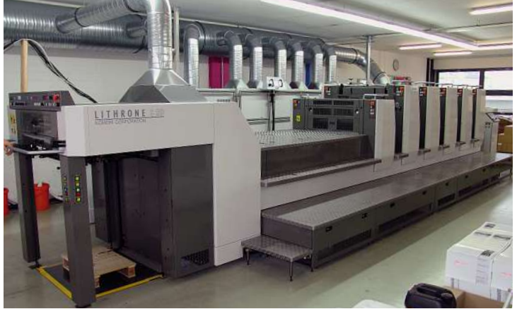
Fertig installiert und einsatzbereit: die neue Komori LS 529 HC der Elbtal Gruppe.

Doch alles lief nach Plan. Die als Zusatzmaschine gewählte Komori im Mittelformat stand am Abend an ihrem Platz und der seit langem bekannte, gute Service der Firma Grafitech nahm seinen Lauf: Das Unternehmen startete die Einweisung und übernimmt natürlich die Betreuung der Maschine zusammen mit dem Service an den beiden