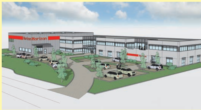
In Quickborn soll die neue Zentrale der Horizon GmbH entstehen – für das 9 000 m 2 große Gelände sind Büro- und Hallengebäude geplant.

Die Passauer Euro-Druckservice GmbH (EDS) hat am 18. Dezember 2008 ihr österreichisches Tochterunternehmen, die Landesverlag Druckservice GmbH (LVDS) in Wels an die Moser Holding (Innsbruck) verkauft. Mit diesem Schritt will sich die EDS nach eigenen Angaben weiter auf ihre Kernmärkte in Zentral- und Osteuropa konzentrieren. Zur Moser Holding gehören bereits die Intergraphik GmbH in Innsbruck und die Moho Druckservice GmbH bei Salzburg. Die zwei Druckstandorte sollen mit der LVDS unter dem Dach der neugegründeten Medien-Druck AG, einem hundertprozentigen Tochterunternehmen der Moser Holding, zusammengeführt werden. Mit dem Kauf des Landesverlag Druckservice Wels will die Moser Holding ihre Marktposition stärken. Bereits jetzt seien die Moser-Töchter Oberösterreichische Rundschau GmbH und Print Zeitungsverlag GmbH die Hauptkunden des Welsener Unternehmens, das mit zwei Rotationsmaschinen Tages-, Wochen- und Monatszeitungen produziert.