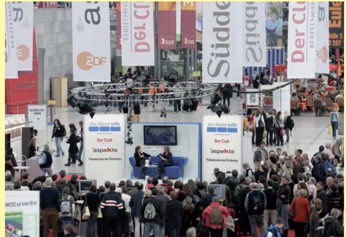
Rund 2 300 Aussteller werden auf der diesjährigen Leipziger Buchmesse erwartet. Zu den Messe-Neuheiten gehört der »Karrieretag Buch + Medien«, um den das Segment Bildung erweitert wird.

Unter dem Titel »1989 – 2009. Wohin treibt Europa?« lädt die Buchmesse und gemeinsam mit dem literarischen Colloquium Berlin sieben Schriftsteller aus unterschiedlichen Ländern dazu